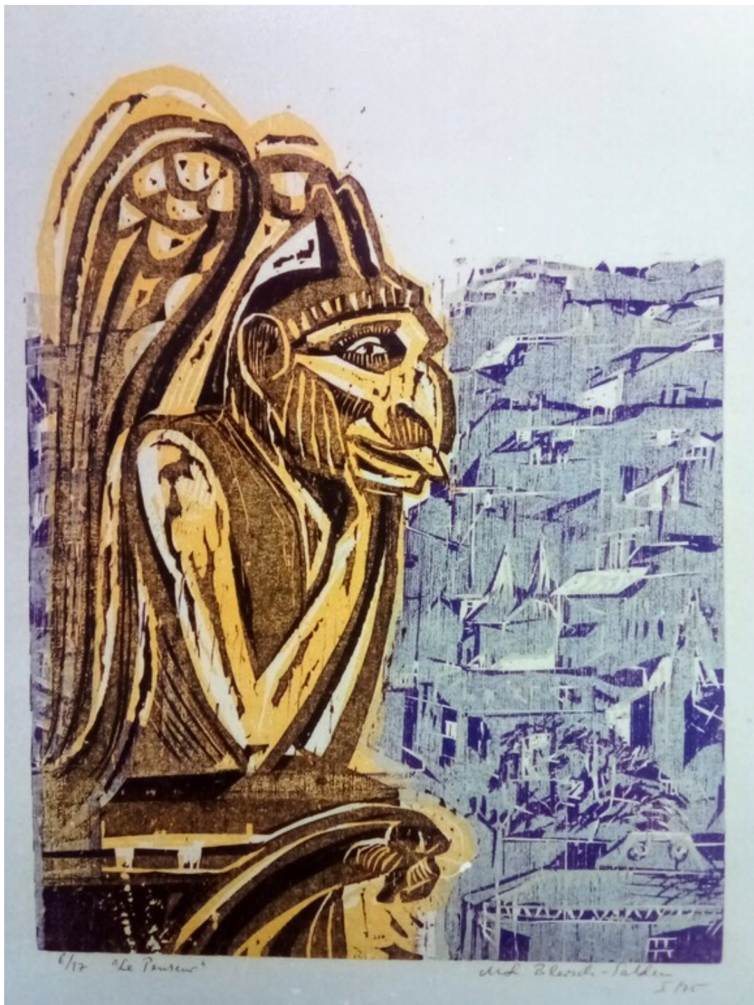
Bild des Monats der Graphothek: "Le Penseur / Der Denker" (Marie-Luise Blersch-Salden, 1975)

„Wer die Freiheit aufgibt, um Sicherheit zu gewinnen, wird am Ende beides verlieren.“ (Benjamin Franklin)